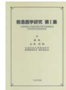
救急医学研究 第 I 集 (平成 8 年 11 月 14 日発行)